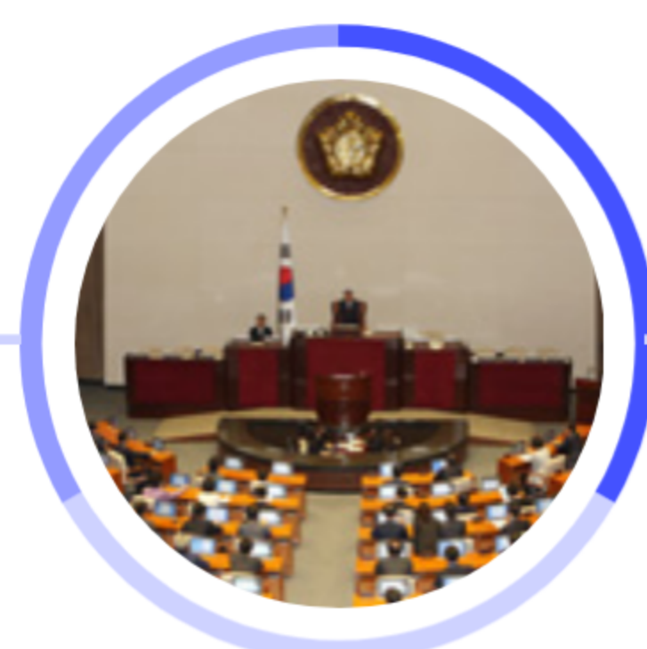
정치 및 사회여론