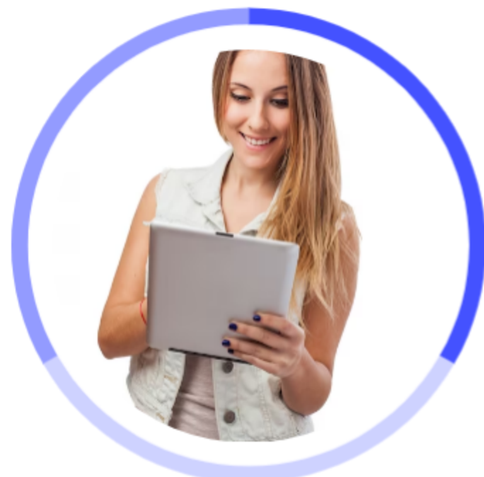
소비자 및 전문가 온라인 패널