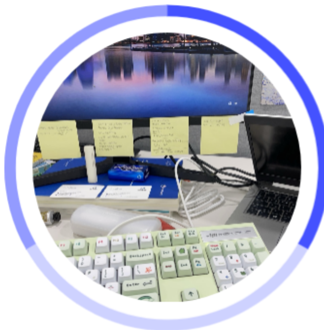
*우선순위에 따라 업무를 정리한 모습

대학생 인턴이라고 해서, 실습생이라고 해서, 아무것도 하지 않고 가만히 있다 오는 건 실습에 참여하지 않는 것과 다름 없다고 생각했습니다. 현장 실습생으로서 값진 경험을 얻어내기 위해선 적극적인 태도로 일을 찾아서 하는 것이 중요합니다.